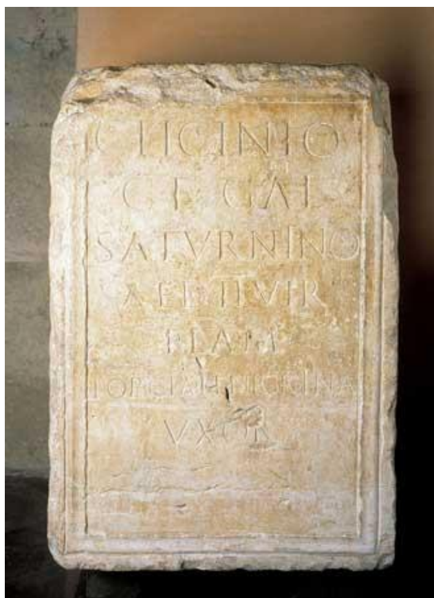
Fig. 1. Inscripción dedicada a Cayo Licinio Saturnino (Lérida, Lérida, Cataluña, España).

Wiegels, Rainer (1985). Die Tribusinschriften des römischen Hispanien. Ein katalog . Berlín: De Gruyter, p. 166.